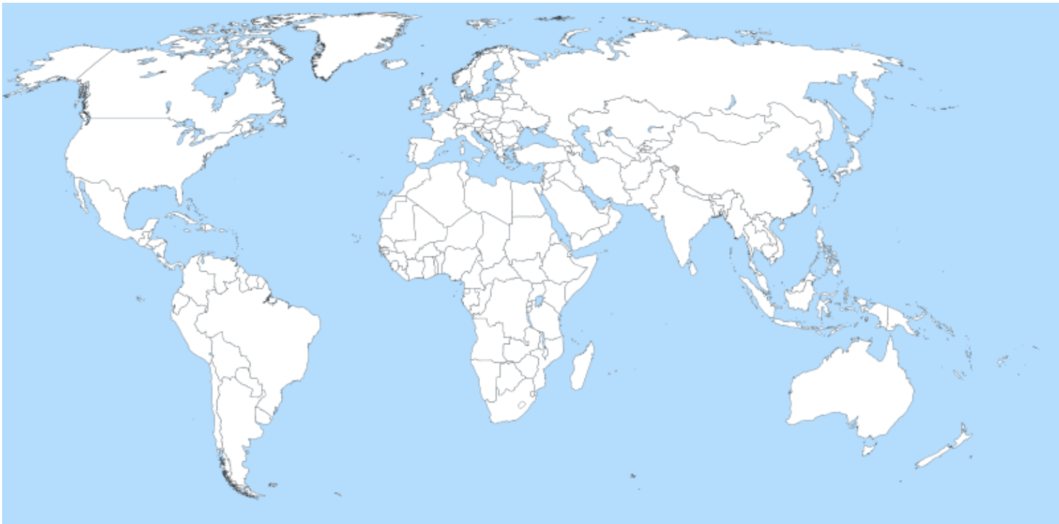
Mapa mundi en blanco. José García López.