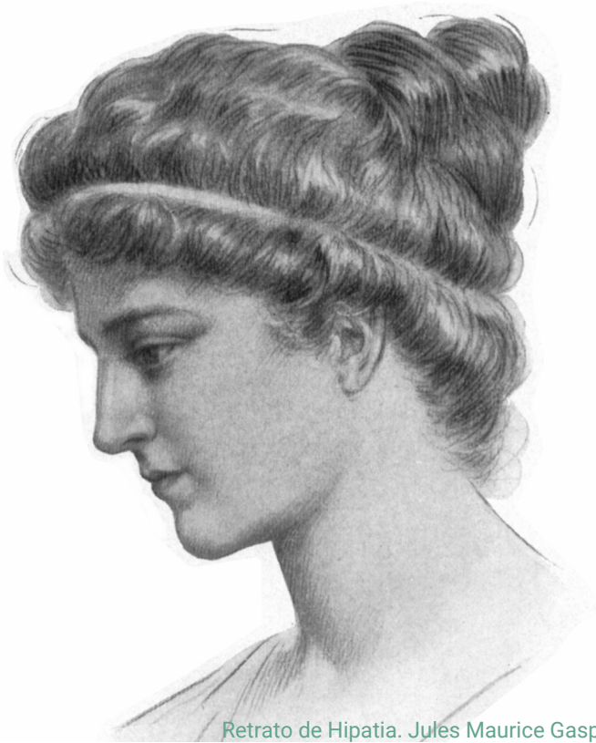
Retrato de Hipatia. Jules Maurice Gaspard