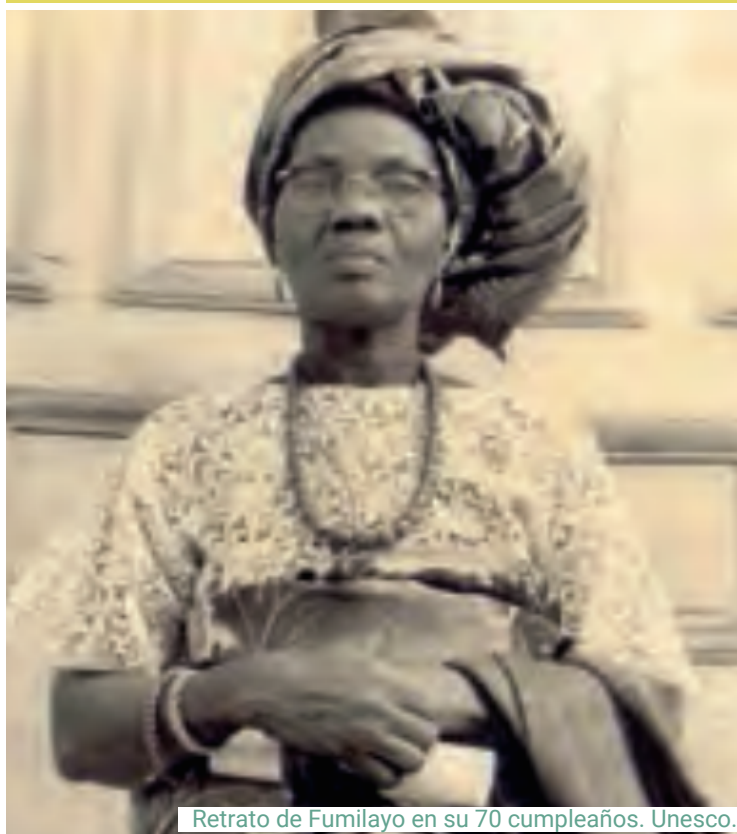
Retrato de Funmilayo en su 70 cumpleaños. Unesco.

También realizaba ilustraciones de plantas, siendo la ilustradora científica en instituciones como el Chicago Field Museum o el Departamento de Agricultura de su país. Así mismo, es reconocida por su trabajo como activista por el sufragio femenino, participando en la huelga de hambre de 1918, durante la cual fue encarcelada y alimentada a la fuerza.